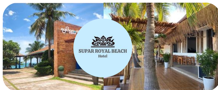
Supar Royal Beach Hotel