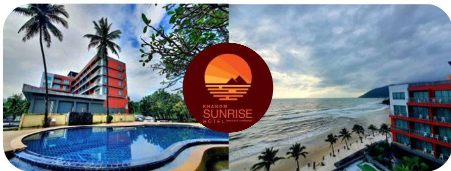
Khanom Sunrise Resort And Hotel