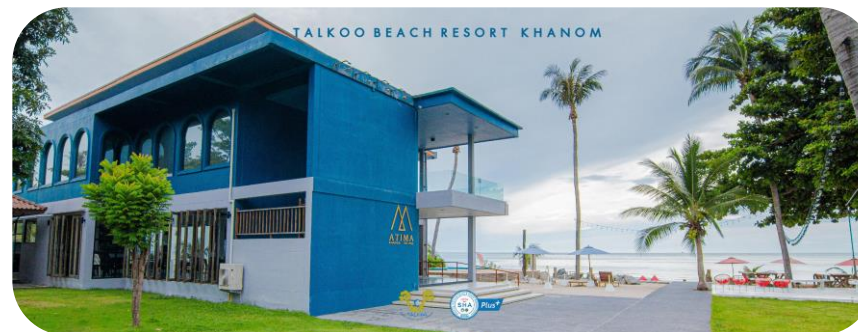
Talkoo Beach Resort Khanom