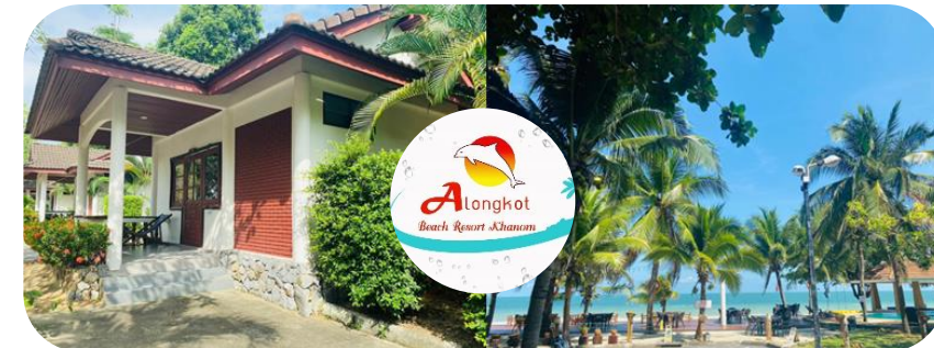
Alongkot Resort, Khanom