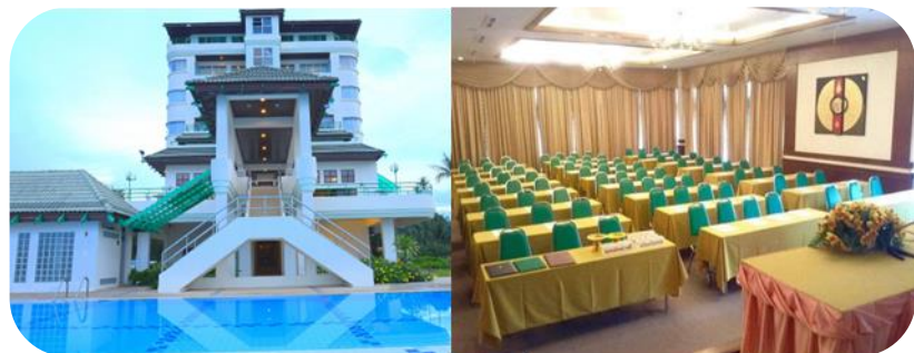
Khanom Golden Beach Hotel