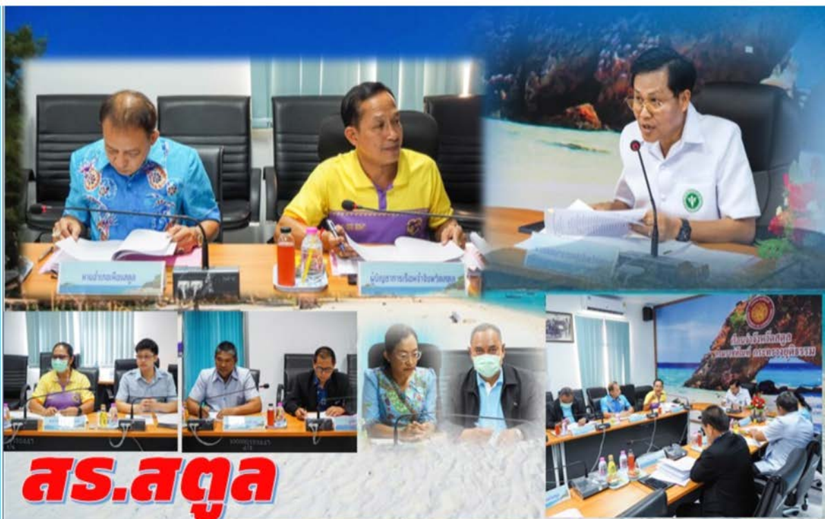
ประชุมคณะกรรมการพัฒนาระบบบริการสุขภาพผู้ต้องขัง ในเรือนจำจังหวัดสตูล ตามโครงการราชทัณฑ์ปันสุข ๔